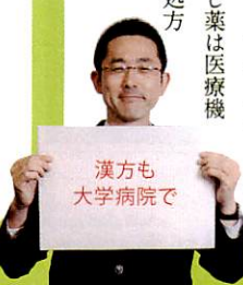
漢方も大学病院で