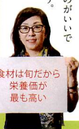
食材は旬だから栄養価が最も高い